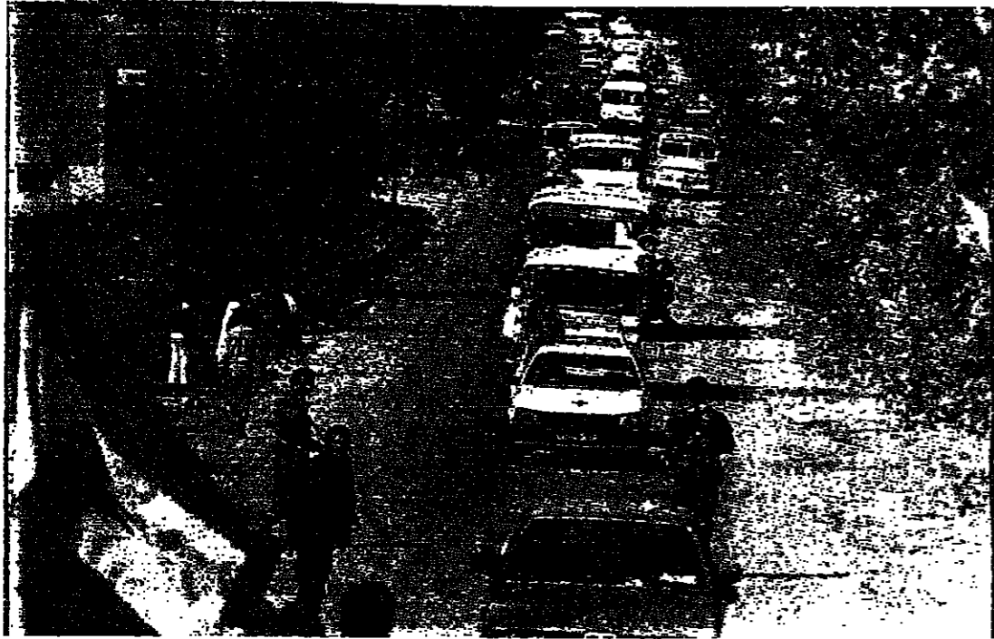
موكب المعتقلين من الاحتلال الإسرائيلي (محمود الطويل)